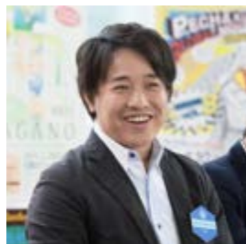
📍 奈良 高松明弘 編集奈良